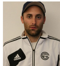
Marcel Hefti Sportkommission